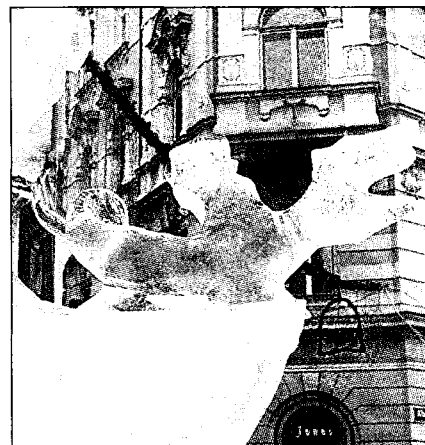
Armer Eis-Lindwurm: Sein Schweif ist nur mehr ein Schwänzchen.